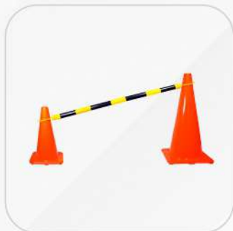
BARRA DELMITADORA RETRACTIL 1.20M - 2.40M