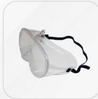
MONOGOGLE CLARO WILLSON