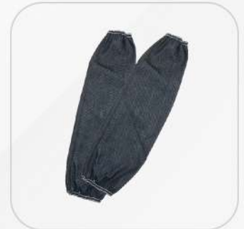
MANGAS DE MEZCLILLA