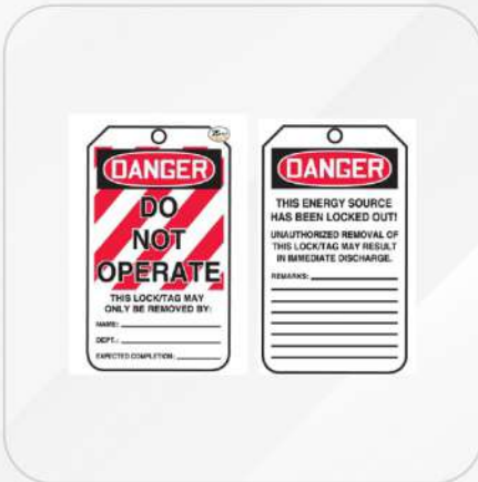
TARJETA NO OPERAR