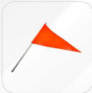
BANDERÍN PARA DEFENSA DE CAMIÓN