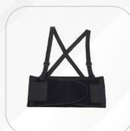
FAJA LUMBAR CON TIRANTES (TALLAS CH, MED, GDE, XL)