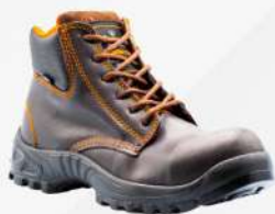
BORCEGUI INDUSTRIAL 214 P- AVANZA