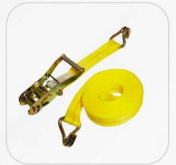
BANDA PARA CARGA 2X27" GANCHO DOBLE