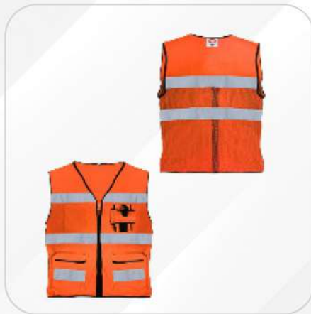
CHALECO BRIGADISTA CON MALLA EN ESPALDA