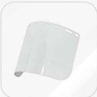
MICA CLARA PARA PROTECTOR FACIAL