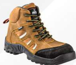
BORCEGUI 614 PM VINKEL