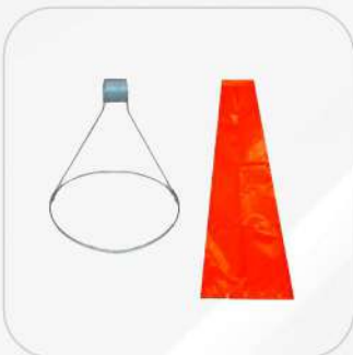
HERRAJE 10" PARA CONO DE VIENTO