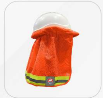
CUBRE NUCA NARANJA CON REFLEJANTE