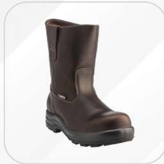
ROOPER AVANZA 406