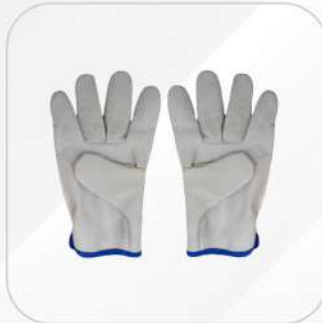
GUANTE ARGONERO PIEL DE RES