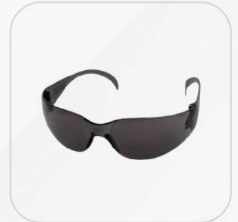
LENTE STEEL OBSCURO Y CLARO