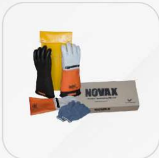
KIT COMPLETO GUANTES DIELÉCTRICOS