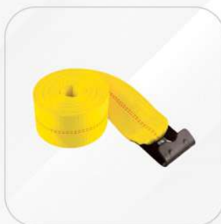
BANDA PARA CARGA 4X30" GANCHO PLANO SIN MATRACA