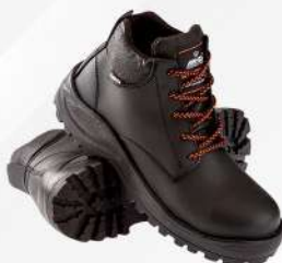
BORCEGUI AVANZA 210