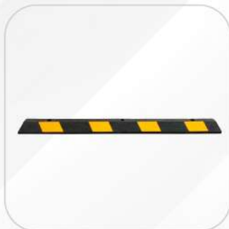
TOPE PARA ESTACIONAMIENTO 1.80M