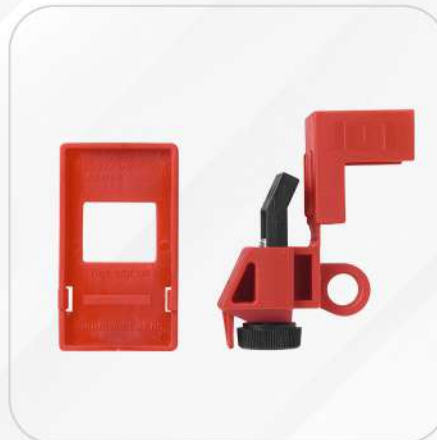
BLOQUEO PARA INTERRUPTORES UNIPOLARES