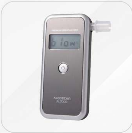
ALCOSCAN AL 6000