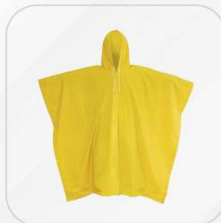
IMPERMEABLE TIPO POCHO