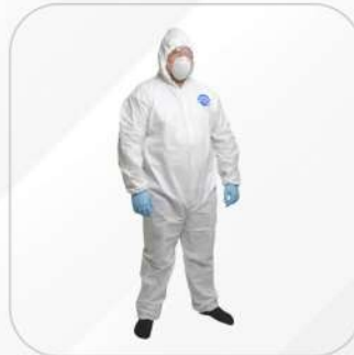
OVEROL DESECHABLE XL