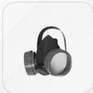
RESPIRADOR MEDIA CARA DERMA CON CARTUCHOS PARA VAPORES ORGÁNICOS