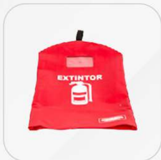
FUNDA PARA EXTINTORES