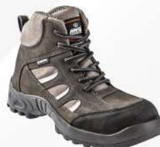
BORCEGUI 614 PG VINKEL