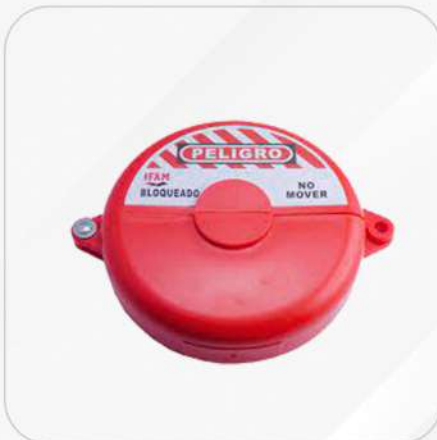
BLOQUEOS PARA VALVULAS DE COMPUERTA