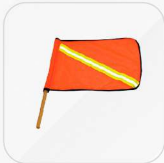
BANDERA CON REFLEJANTE