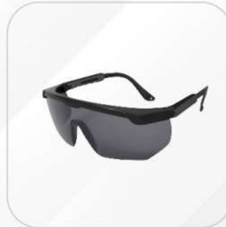
LENTE SARGENTO OBSCURO Y CLARO