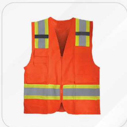
CHALECO SUPER RESCATISTA SR1035