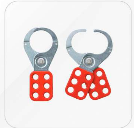
ALDABA DE ACERO