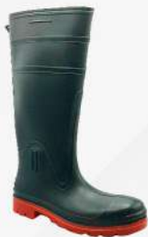
BOTA DE HULE CON CASCO DE ACERO