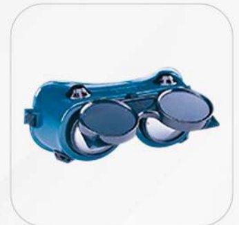
GAFAS PARA SOLDADOR #5