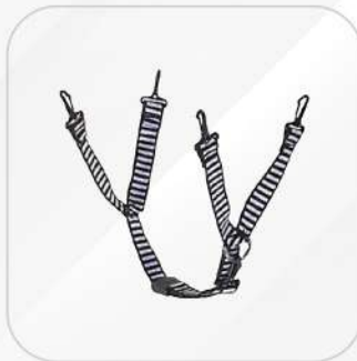
BARBIQUEJO 4 PUNTOS MSA