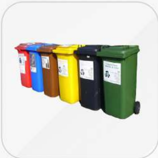
CONTENEDOR PARA DESECHOS