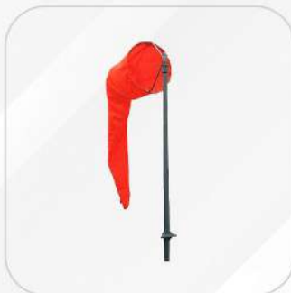
CONO O MANGA DE VIENTO 10"