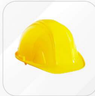
CASCO TIPO CACHUCHA SUSPENSIÓN INTERVALOS IGA