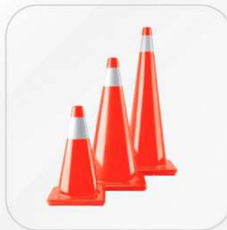
CONOS NARANJA 45 CM Y 71 CM (CON Y SIN REFLEJANTE)