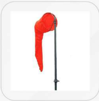
CONO O MANGA DE VIENTO 10"