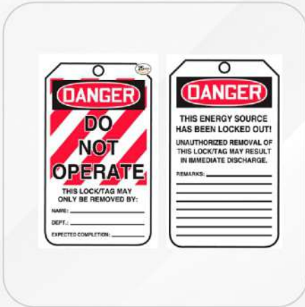
TARJETA NO OPERAR