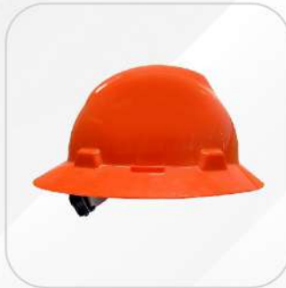
CASCO MSA ALA COMPLETA SUSPENSIÓN MATRACA