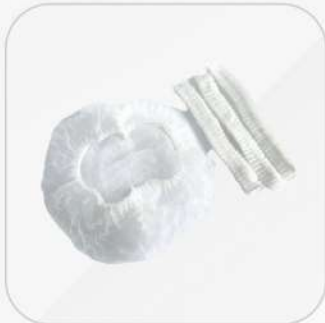
COFIA PLISADA BLANCA