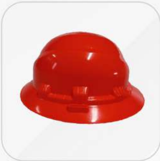
CASCO IGA ALA COMPLETA DIELÉCTRICO