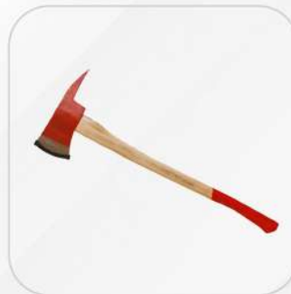
HACHA DE BOMBERO