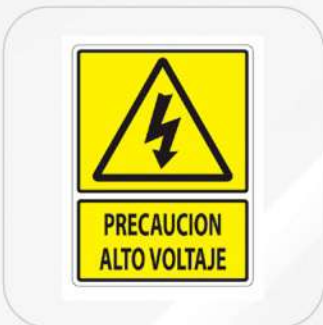
PRECAUCIÓN ALTO VOLTAJE