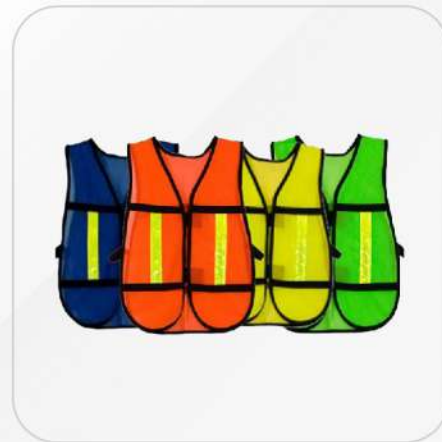
CHALECO DE MALLA CON REFLEJANTE