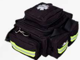
BOTIQUIN TIPO MALETIN