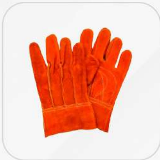
GUANTE DE CARNAZA CORTO