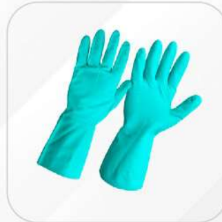
GUANTE DE NITRILLO USO INDUSTRIAL 5315