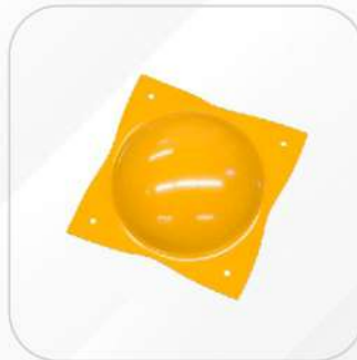
BOYA METÁLICA CON 4 CLAVOS