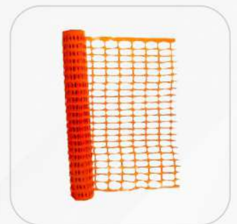
MALLA NARANJA 1M X 45M