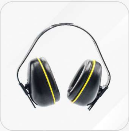
OREJERAS TIPO DIADEMA