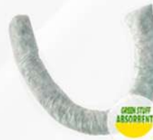
MANGA ABSORBENTE DE 1.20 M