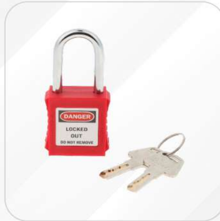
CANDADO ROJO LOCKED OUT