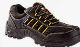
TENIS INDUSTRIAL MOD. 217 PN-VINKEL