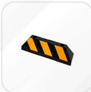
TOPE PARA ESTACIONAMIENTO 56 CM