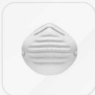
MASCARILLA PARA POLVOS