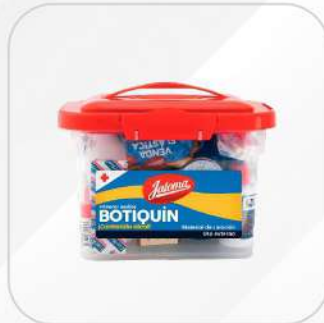
BOTIQUÍN PLÁSTICO CON 22 PZS