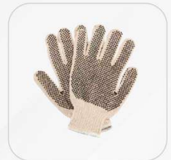
GUANTE JAPONÉS CON PUNTOS DE PVC