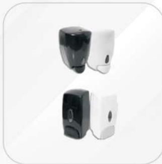
DESPACHADORES DE JABÓN