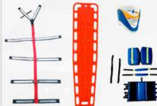
KIT DE INMOVILIZACIÓN