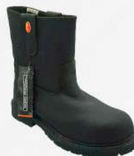
BOTA GAMA CASCO DE ACERO M: 40