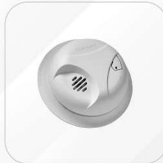
DETECTOR DE HUMO