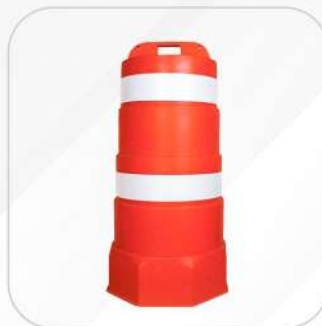
TRAFITAMBO CON 2 REFLEJANTES