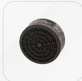
CARTUCHOS PARA PINTURA PRETUL