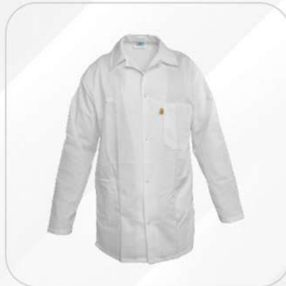
BATA CORTA ANTIESTÁTICA