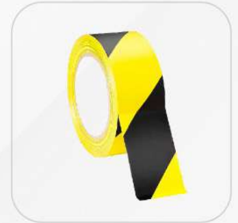
CINTA DELIMITADORA DE ÁREAS