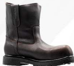
BOTA RAMCO PETRO WELT