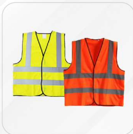
CHALECO UNITALLA SR1013