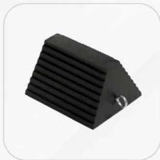
CALZAS PARA LLANTA