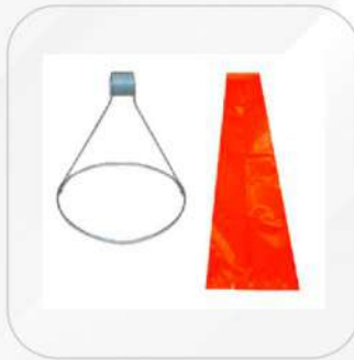
HERRAJE 10" PARA CONO DE VIENTO