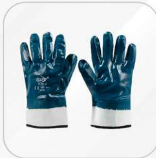
GUANTE NITRILLO PUÑO DE SEGURIDAD