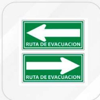
RUTA DE EVACUACIÓN