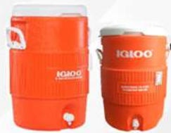
TERMOS IGLOO (CAPACIDAD DE 5 Y 10 GALONES)