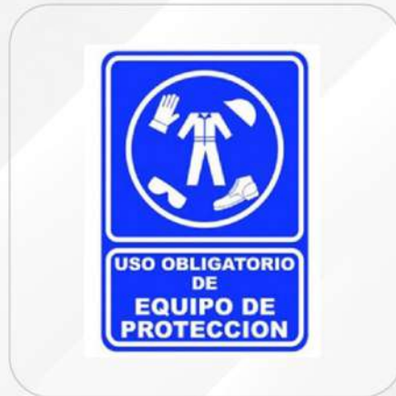
USO OBLIGATORIO DE EQUIPO DE PROTECCIÓN