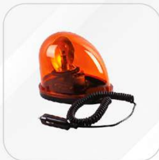
TORRETA AMBAR GIRATORIA