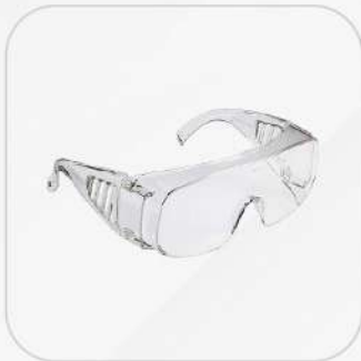
LENTE VISITANTE CLARO