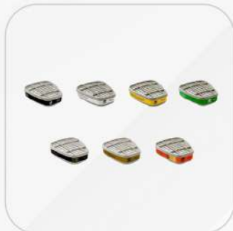
CARTUCHOS 3M 6001, 6002, 6003, 6006