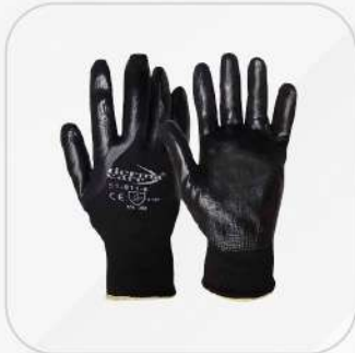
GUANTE NYLON CON NITRILO (TALLA XS, S, M, L)