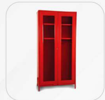
GABINETES PARA TRAJE DE BOMBERO