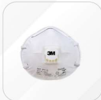
MASCARILLA 3M MODELO 8822