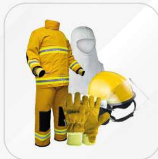
KIT DE BOMBERO