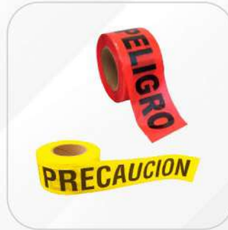
CINTA BARRICADA PRECAUCIÓN / PELIGRO