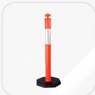
POSTE DELIMITADOR 1.10M DE ALTO