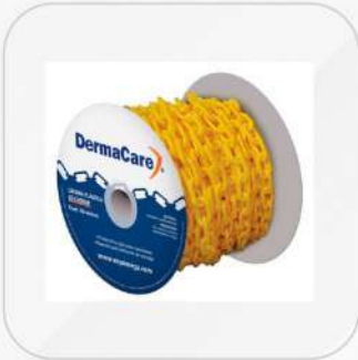
CADENA PLASTICA 50M X 6 MM EN AMARILLO Y ROJO