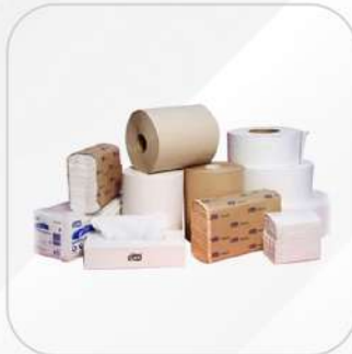
TOALLAS DE PAPEL