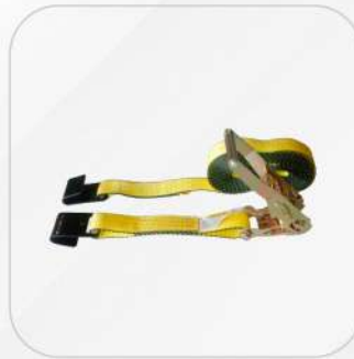
BANDA PARA CARGA 2X27" GANCHO PLANO DOBLE