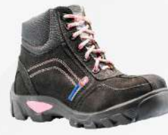
BOTA BORCEGUI CON CASCO DE POLIAMIDA