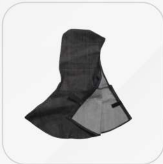
CAPUCHA DE MEZCLILLA PARA SOLDADOR