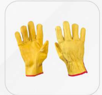
GUANTE ARGONERO PIEL DE CERDO CON ELÁSTICO