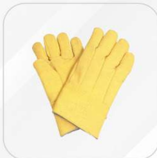
GUANTE INSULADO ALTAS TEMPERATURAS