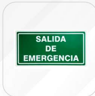
SALIDA DE EMERGENCIA