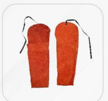
MANGAS DE CARNAZA