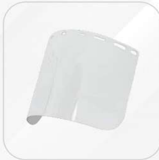
MICA CLARA PARA PROTECTOR FACIAL