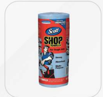
TOALLAS MULTIUSOS SCOTT