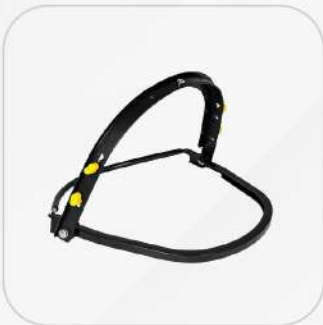
ADAPTADOR PARA MICA FACIAL