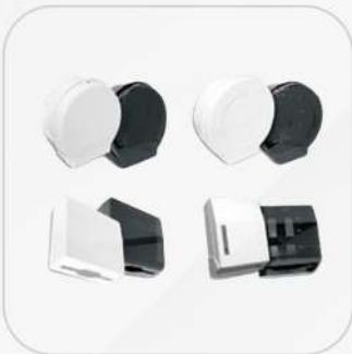
DESPACHADORES DE PAPEL