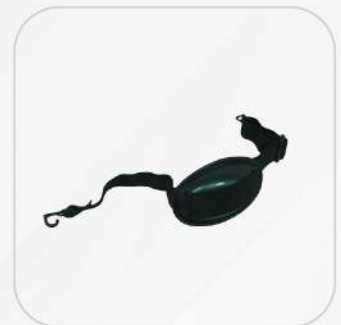
BARBIQUEJO CON MENTONERA