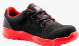
TENIS INDUSTRIAL CON CASQUILLO MR