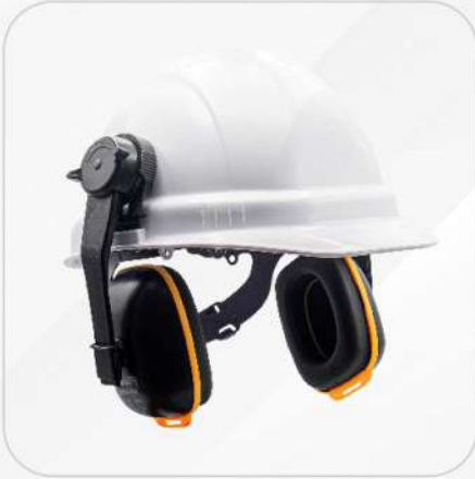
OREJERAS ADAPTABLES A CASCO