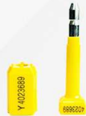
SELLOS DE SEGURIDAD