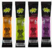
BEBIDA HIDRATANTE VARIOS SABORES (CAJA CON 32 SOBRES RINDE 302)