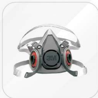
RESPIRADOR 3M MEDIA CARA MODELO 6200