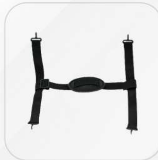
BARBIQUEJO 4 PUNTOS UNIVERSAL CON MENTONERA