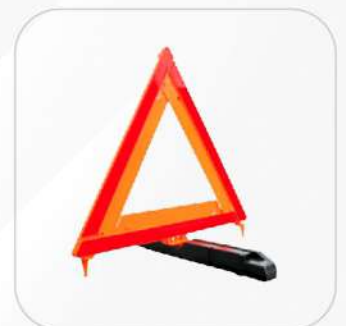
TRIÁNGULO DE VIALIDAD