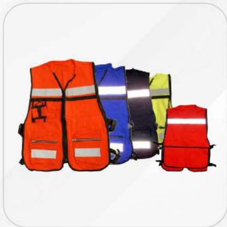
CHALECO BRIGADISTA 100% ALGODÓN