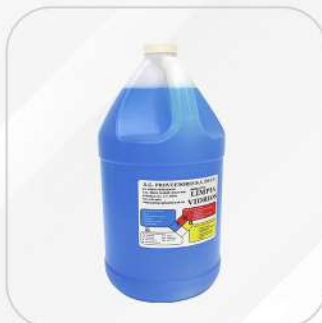
LIMPIA VIDRIOS GENÉRICO