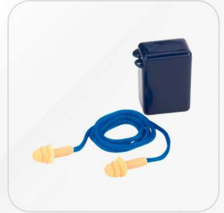
TAPÓN REUSABLE CON ESTUCHE