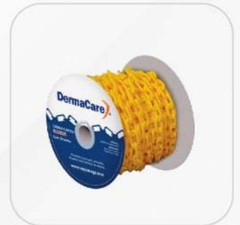
CADENA PLÁSTICA 50M X 6 MM EN AMARILLO Y ROJO