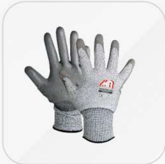
GUANTE ANTICORTE CON POLIURETANO EN PALMA N5