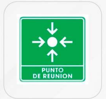
LETRERO PUNTO DE REUNIÓN MEDIDA- 20 X 40 CM