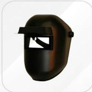
CARETA PARA SOLDAR TERMOPLÁSTICA