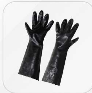
GUANTE DE PVC VS QUÍMICOS