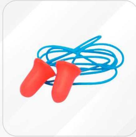
TAPÓN AUDITIVO DESECHABLE