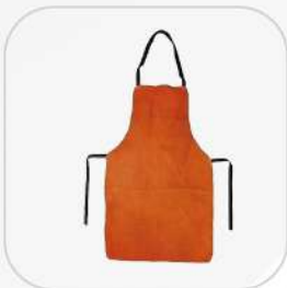
PETO DE CARNAZA