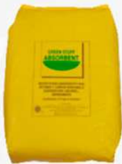
ABSORBENTE GRANULADO BOLSA DE 2.5KG