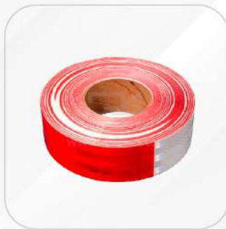
CINTA REFLEJANTE ROJA/BLANCO