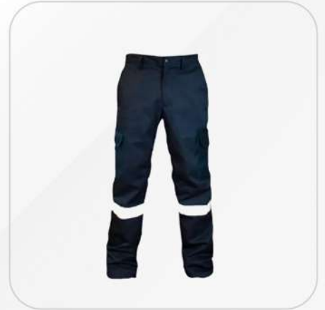
PANTALON TIPO CARGO