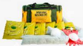
KIT ABSORBENTES DE HIDROCARBUROS