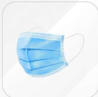
CUBREBOCAS PLISADO CELESTE