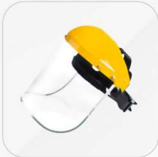
CABEZAL PARA PROTECTOR FACIAL