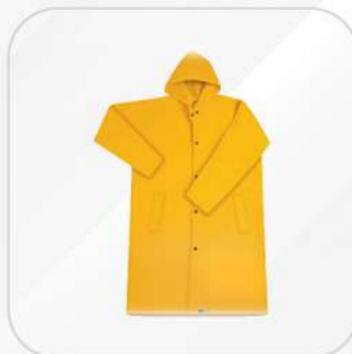
IMPERMEABLE GABARDINA AMARILLO