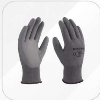
GUANTE NYLON CON PALMA DE POLIURETANO (TALLA S, M, L)