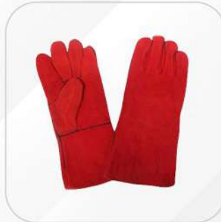
GUANTE SOLDADOR ROJO CON HILO KEVLAR