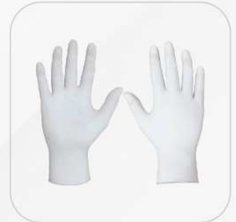
GUANTES DESECHABLES DE NITRILO HILL SAFE