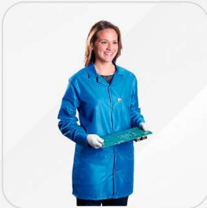
BATA ANTIESTÁTICA AZUL REY