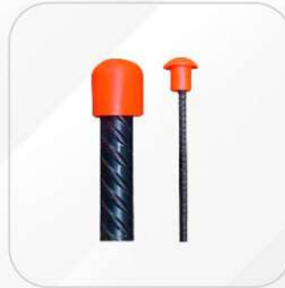
CAPUCHÓN PARA VARILLA 3/8 A 3/4