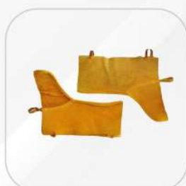
POLAINAS DE CARNAZA