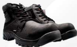
BORCEGUI PARA PIE DIABETICO